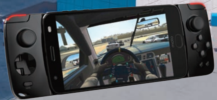
The Moto Z 2 Force and the Moto Gamepad