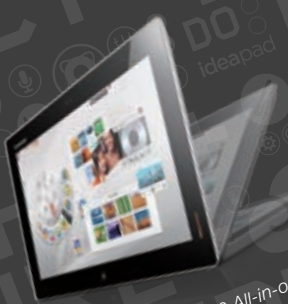
Lenovo Flex 20 All-in-one