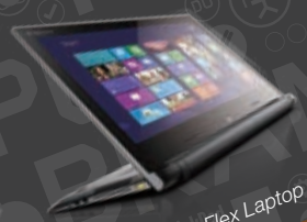
Lenovo Flex Laptop