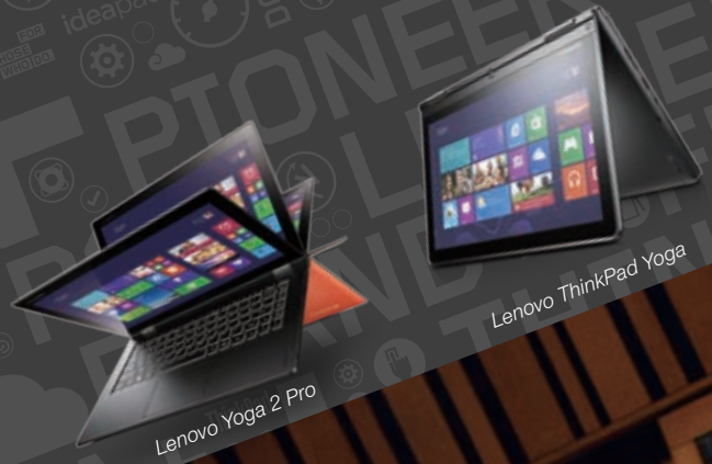
Lenovo Yoga 2 Pro